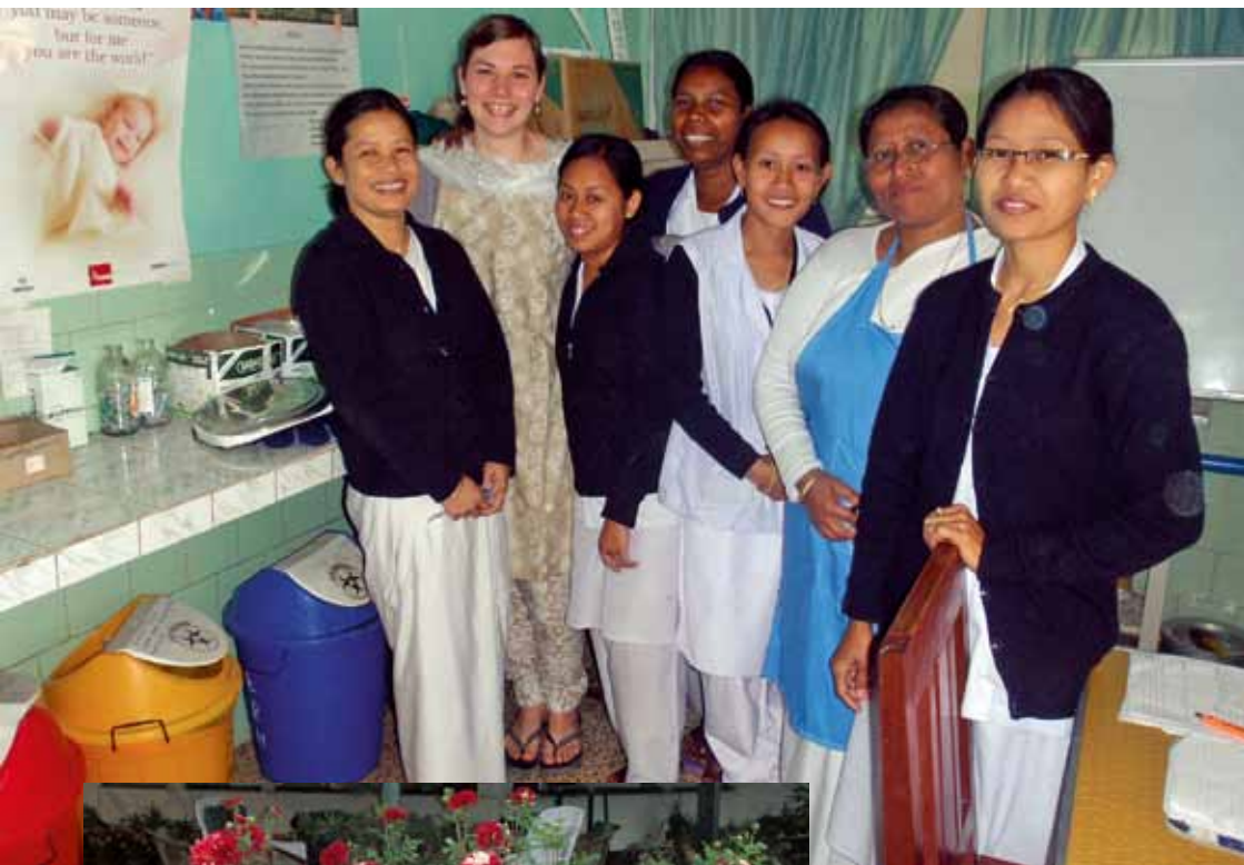
Das Team der lokalen Pflegefachfrauen vom Emmanuel Rural Hospital ist eine herzliche Familie.